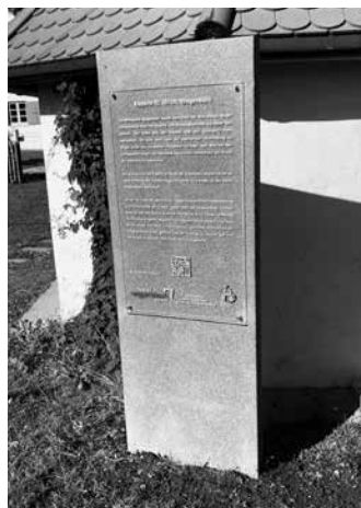
Kapelle St. Ulrich, Wagenbühl