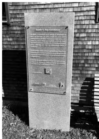
Kapelle St. Rita, Schmidtsreute