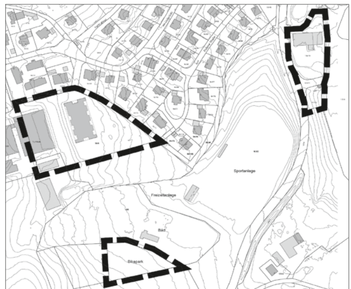
Abbildung 1: Lageplan der Bereiche südlich von Wiggensbach, unmaßstäblich

Fl.-Nr. 169/10, 169/11, 169/12 und 169/14 mit ca. 0,4 ha. Alle Grundstücke liegen auf der Gemarkung Wiggensbach. (siehe auch Abbildung 1). Im Bereich Ermengerst an der Römerstraße umfasst der Geltungsbereich die Grundstücke der Fl.-Nrn. 729/4, 729/5, 728 (Teilfläche), 603/7 (Teilfläche). (siehe auch Abbildung 2). Im Einzelnen gelten die Lagepläne vom 10. Juli 2023 (sh. abgedruckte Pläne).