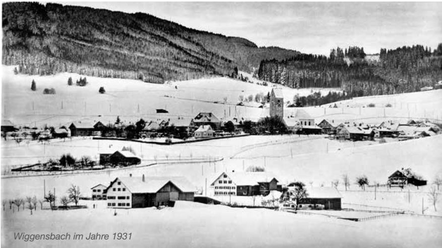
Wiggensbach im Jahre 1931

Allen Bürgerinnen und Bürgern wünsche ich, auch im Namen des Markt-gemeinderates und meiner Mitarbeiterinnen und Mitarbeiter vom Bauhof, Haus Kapellengarten, von der Kindertagesstätte und vom Rathaus