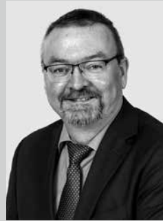
Christian Oberhaus 2. Bürgermeister