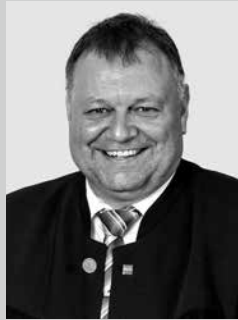
Thomas Eigstler 1. Bürgermeister